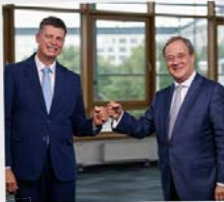
Kandidat für Deutschland

Mit Armin Laschet haben wir einen Kanzlerkandidaten, der in seinen bisherigen politischen Ämtern in Bonn, Brüssel und Berlin bereits wichtige Akzente gesetzt hat und als Ministerpräsident von Nordrhein- Westfalen auch über Regierungser- fahrung verfügt. Seinem Motto „Zuhören, entscheiden, handeln“ schließe ich mich gerne an. Wir wollen gemeinsam Zusammenhalt stiften und Zukunft gestalten.