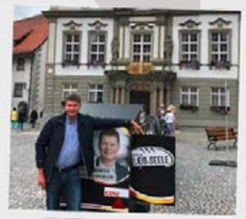
Politik mit Laeib und Seele

Mit dem Politikladen in der Ravensburger Innenstadt habe ich eine weitere Anlaufstelle für die Bürgerinnen und Bürger geschaffen. Der Name ist ganz bewusst gewählt – einen Laden kann man spontan betreten und sich informieren. Man spaziert während der Öffnungszeiten einfach hinein.