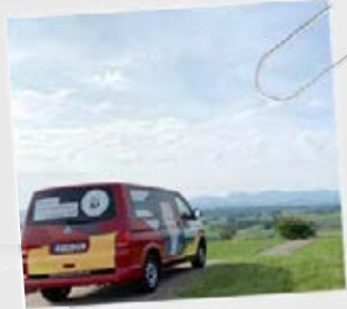
Politik auf Achse

Ich habe versprochen, Abgeordneter für die gesamte Region zu sein – von A wie Achberg bis Z wie Zußdorf. Dafür war ich mit meinem mobilen Wahlkreisbüro auf Achse und habe in allen rund 70 Städten, Gemeinden und Ortschaften Bürgersprechstunden angeboten.